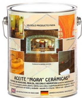
ACEITE MORA CERAMICAS MATE (APLICACIÓN EN 3 CAPAS)