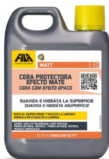
FILA MATT → CERA SELLANTE (1 CAPA)