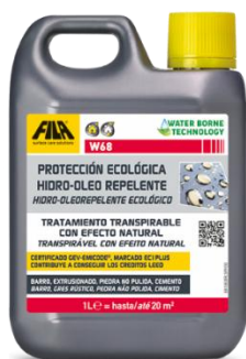
FILA W68 → PROTECTOR (2 CAPAS)