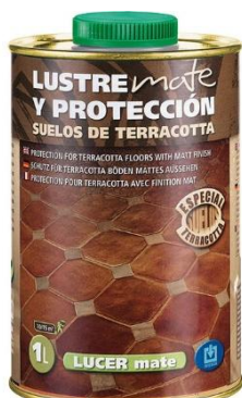
LUCER MATE → CERA SELLANTE (1 CAPA)